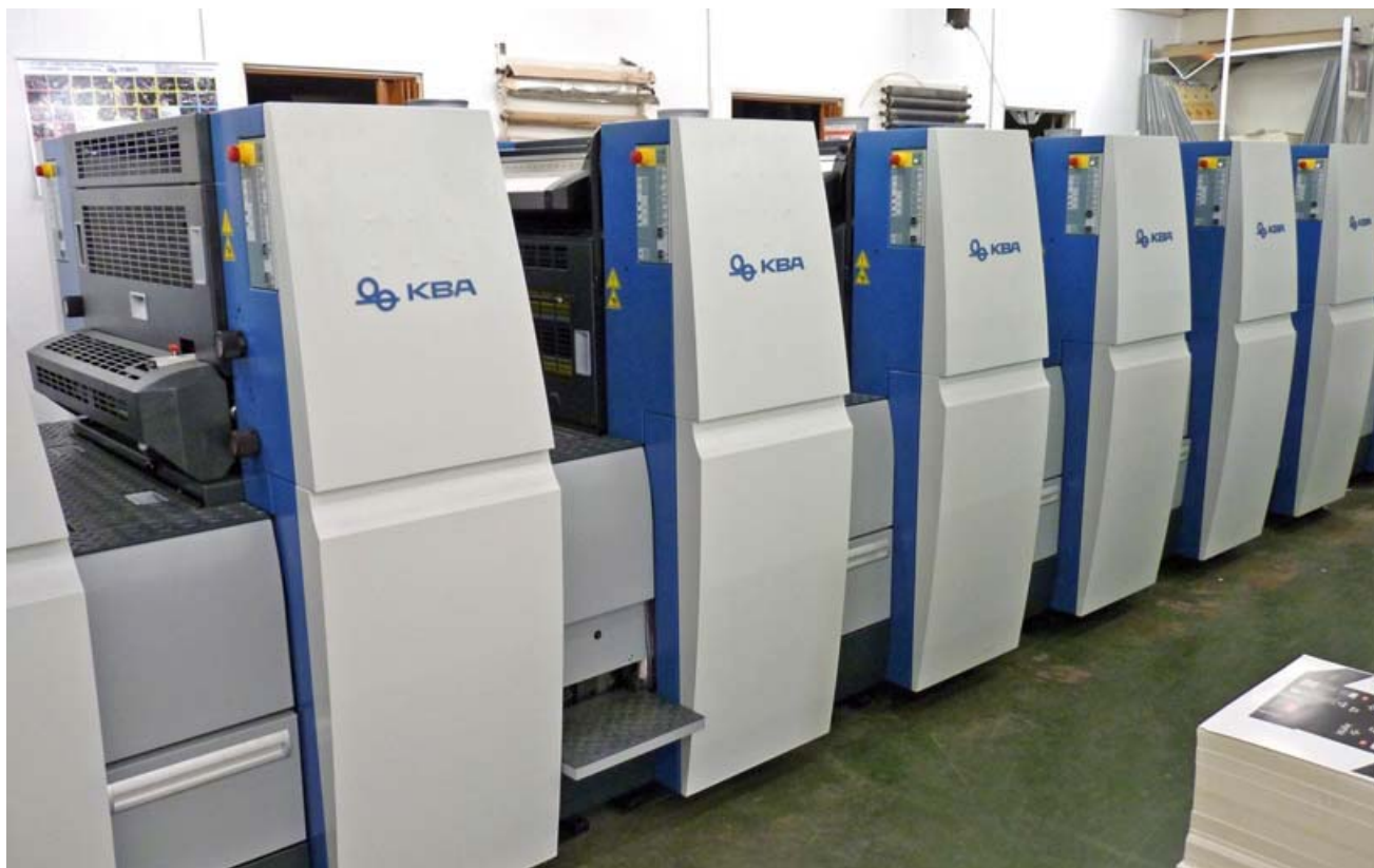
Nowa maszyna offsetowa drukuje w 1 procesie technologicznym w 5 kolorach i lakieruje papier.

Sama maszyna to jednak nie wszystko. Drukarnia została też wyposażona w cały system informatyczno-komunikacyjny o nazwie Galileo, który służy do kompleksowej obsługi drukarni. Służy on też do obsługi klienta wraz z kalkulacjami robót poligraficznych. – Dzięki tej inwestycji łowicka Poligrafia jest najlepiej wyposażoną i najnowocześniejszą drukarnią w regionie – uważa Wiesław Kacprzak. mak